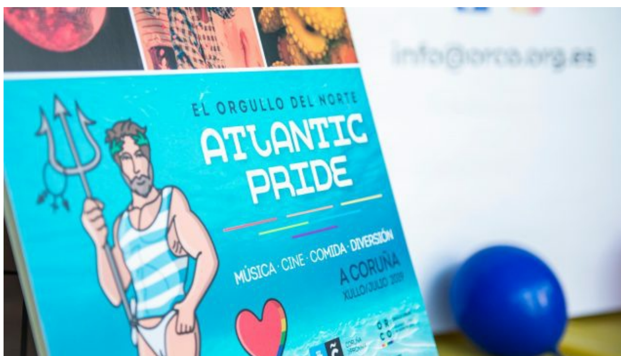
Cartel del evento ATLANTIC PRIDE

A Coruña tendrá su propia fiesta de reivindicación de la diversidad LGTBIQ+. Se celebrará entre el 7 y el 13 de julio , en lo que será una semana llena de actividades reivindicativas, música y colores.